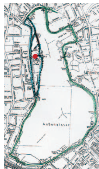
● = Start/Ziel

Wir freuen uns auf Sie und wünschen Ihnen eine gute Anreise!